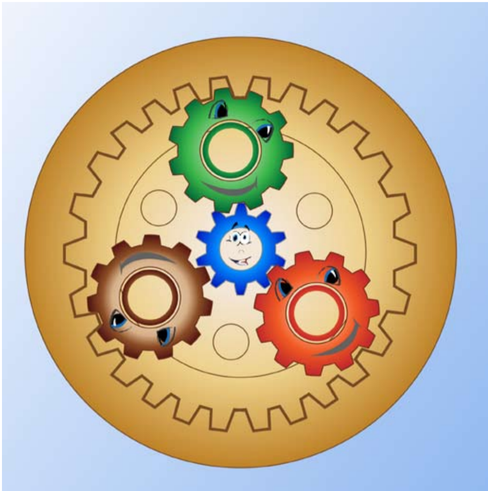
Illustriert von Roman Ferber

So kam der Tag, an dem uns alles so sinnlos erschien, dass wir uns an unseren alten Zustand zurückerinnerten, an die alten Zeiten, als wir glücklich waren, als wir miteinander verbunden waren wie die Zahnräder. Und sofort begannen wir, die anderen wieder zu lieben, uns mit ihnen zu vereinigen und an den herrlichen alten Platz „Die Eine Seele“ zurückzukehren. Ja, das taten wir. Und nun wissen wir wieder, was wahre Freude ist.